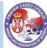
MEDALJE SRBIJE PO DECENIJAMA - 1951-2020*.